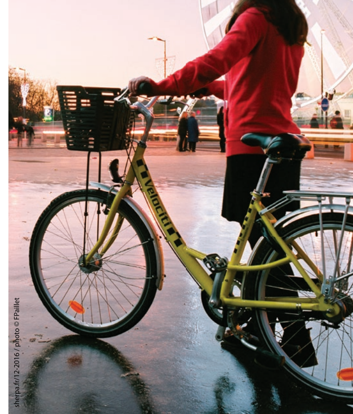
shepa.fr/12-2016 / photo © FPallet