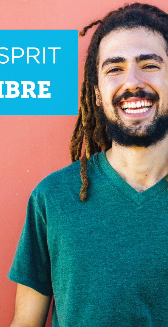
stampa.fr/07-2016 / photo © Kiko Jimenez / Westendb1 / GraphicObsession